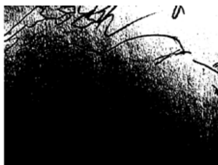
ציור: גל ברזילי

הלילות קשים. תכשיטי אורות העיר מטלטלים את החשכה בתוכי, ואני סוגר את החלונות. עכשו כבר אין דמעות, אין עצב, בעצם אין כלום ויש הכל באותו הזמן.