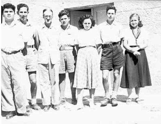
ישעיהו לייבוויץ שלישי משמאל