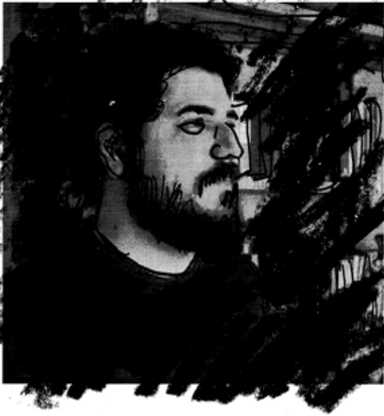
ציור: רוני סומק